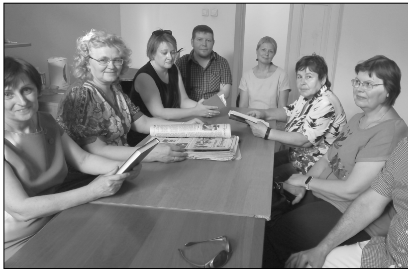
■ ЛИТО «Нефтехима».

Главным результатом президентского гранта «Знай наших – читай наших» стали созданные в десятках школ области клубы любителей «Томской классики». Около 200 ребят записались в эти литературные кружки. С началом нового учебного года, мы уверены, их число возрастет кратно.