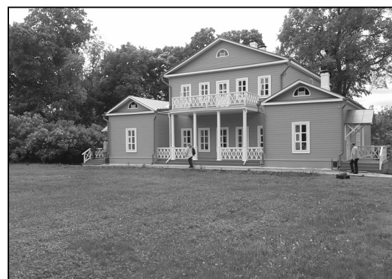
■ Усадьба Арсеньевых в Тарханах.