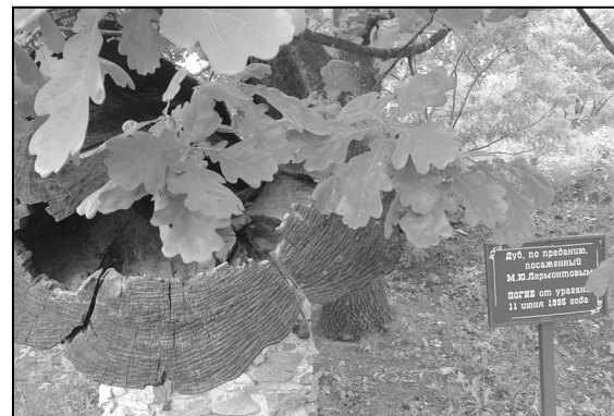
■ Дуб, по преданию, посаженный М.Ю. Лермонтовым. Погиб от урагана 11 июня 1995 г.